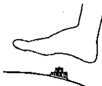
Насадка для стимулирующего акупунктурного массажа