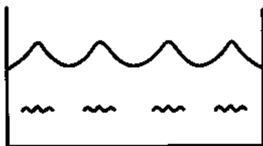
Подогрев + Массаж